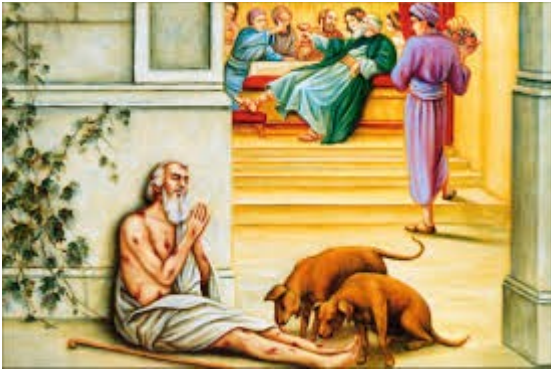
Притча о богаче и Лазаре (Лк. 16:19–31)

Некоторый человек был богат, одевался в порфиру и виссон и каждый день пиршествовал блистательно. Был также некоторый нищий, именем Лазарь, который лежал у ворот его в струпьях и желал напитаться крошками, падающими со стола богача, и псы, приходя, лизали струпья его. Умер нищий и отнесен был Ангелами на лоно Авраамово. Умер и богач, и похоронили его. И в аде, будучи в муках, он поднял глаза свои, увидел вдали Авраама и Лазаря на лоне его и, возопив, сказал: отче Аврааме! умилосердись надо мною и пошли Лазаря, чтобы омочил конец перста своего в воде и прохладил язык мой, ибо я мучаюсь в пламени сем. Но Авраам сказал: чадо! вспомни, что ты получил уже доброе твое в жизни твоей, а Лазарь – злое; ныне же он здесь утешается, а ты страдаешь; и сверх всего того между нами и вами утверждена великая пропасть, так что хотящие перейти отсюда к вам не могут, также и оттуда к нам не переходят. Тогда сказал он: так прошу тебя, отче, пошли его в дом отца моего, ибо у меня пять братьев; пусть он засвидетельствует им, чтобы и они не пришли в это место мучения. Авраам сказал ему: у них есть Моисей и пророки; пусть слушают их. Он же сказал: нет, отче Аврааме, но если кто из мертвых придет к ним, покаются. Тогда Авраам сказал ему: если Моисея и пророков не слушают, то если бы кто и из мертвых воскрес, не поверят.